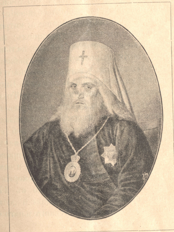
Платонъ, митрополитъ московскій.

Какъ уже сказали, Виѳанія всецѣлообяза на своимъ возникновеніемъ святителю Платону; какъ церковь такъ и кельи и другія монастырскія строенія онъ „производилъ собственнымъ коштомъ“, по планамъ „архитекторіи прапорщика Н. М. Одоевскаго“. Въ 1785 г., 6-го августа, Платонъ освятилъ нижній храмъ во имя воскресенія Лазаря, и черезъ годъ, т.-е. въ 1786 г., 6-го же августа, имъ торжественно освященъ верхній храмъ Преображенія, съ оригинальной искусственной горой, наподобіе горы Ѡваторской; эта гора покрыта мхомъ и цвѣтами; уступы ея и выпуклости и другое убранство „заставляетъ видѣть въ ней чудное подражаніе природѣ“; по обѣимъ сторонамъ горы устроено двѣ лѣстницы; съ лѣвой, какъ будто высѣчена въ скаль. на верху горы находится круглый иконостасъ, очень красивый, рѣзной, украшенный золотомъ и цвѣтными стеклами, увѣнчанный легкимъ, внутри посеребреннымъ, а сверху позлащеннымъ куполомъ. „По мысли Платона, онъ представлялъ главную сѣнь, а съ двухъ сторонъ алтаря на уступахъ горы были устроены другія двѣ сѣни, украшенные цвѣтными стеклами, и все это прекрасно выражало желаніе восхищеннаго апостола устроить на Ѡваторѣ три сѣни“. Надъ престоломъ повѣшенъ вылитый изъ серебра голубъ, вѣсомъ 6 фунт., во вну-